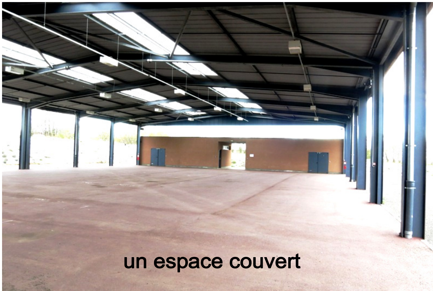
un espace couvert