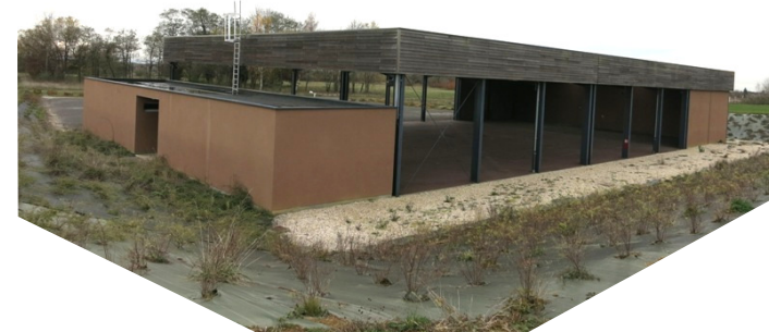
un espace ouvert